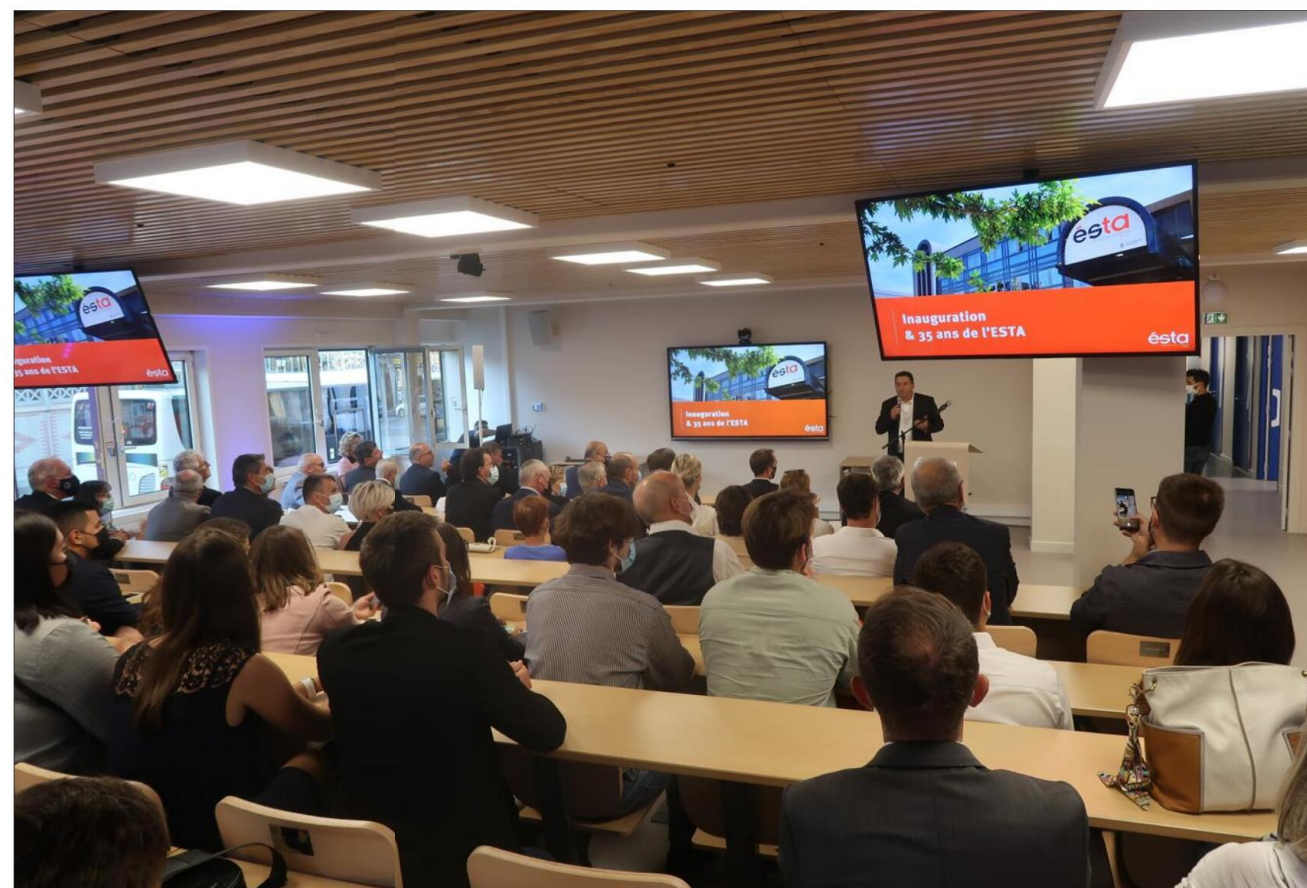
A l'occasion de ses 35 ans, l'Esta a inauguré son nouvel amphithéâtre, baptisé Bartholdi.