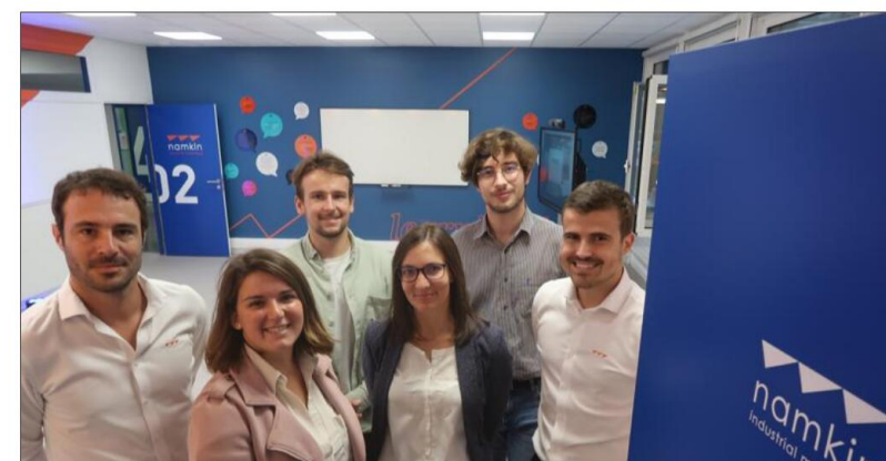
Parmi l'équipe de Namkin, qui a financé le learning lab, d'anciens Estaliens, de retour dans leur école.